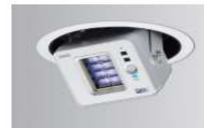
Care222i シリーズを82基設置。感染症対策には余念がない