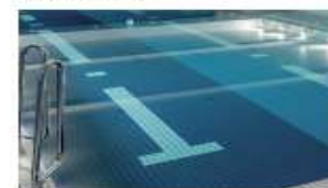
水質管理も徹底している